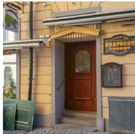
Ingång till Engelen från Triewaldsgränd.