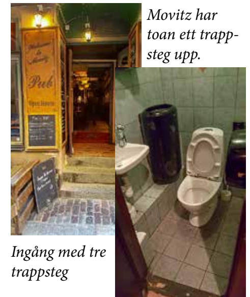
Movitz har toan ett trappsteg upp.

Tre trappsteg in till Movitz. Musiken i gatuplanet. Ett trappsteg upp till toaletten. Toadörren är 61 cm. Trångt men trevlig bar och restaurang.