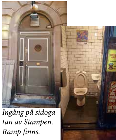
Ingång på sidogatan av Stampen. Ramp finns.

Legendarisk jazzclub med bra mat och dryck. För att komma in på Stampen så är det en trottoarkant och två trappsteg. Det finns en ramp man kan använda. Mycket bra! Musiken i gatuplanet. Väldigt praktiskt. Toadörren är 72 cm bred men toan är liten och har en nivåskillnad på 5-6 cm.