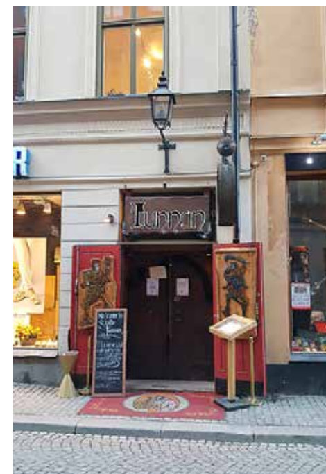
Sjätte tunnan har rullstolshiss men toan fyra trappsteg upp.

PÅ DESSA FYRA PUBAR HUSERAR MUSIKEN I KÄLLARVÅNINGEN MED TRAPPOR AV OLIKA SVÅRHETSGRAD. EN HAR RULLSTOLSHISS.