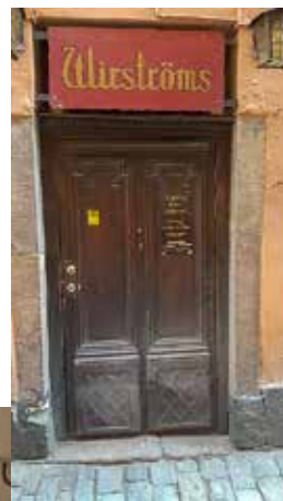
Wirströms är mycket svårtillgänglig.

Från gatan 1 trappsteg. Sedan är det mycket trångt genom puben med trappsteg på slutet. Musiken spelas i källaren, 14 mycket svängda trappsteg. Svårtillgängligt. Toadörren är 82 cm. Ett alternativ är att gå in via gränden. Då får man säga till då det är en nödutgång. Puben är trevlig och oftast välbesökt.