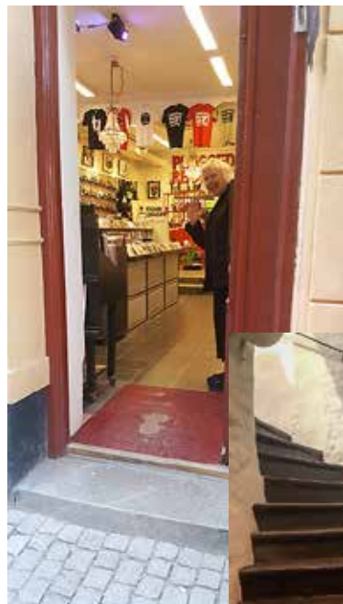
Plugged har ett steg in och en stor bred trappa ner till musiken.

Skivaffär med musik på undervåningen. 1 trappsteg med tröskel in. Vidare ner 17 svagt svängda trappsteg. Med en trappklättrare fungerar det utmärkt. Där nere finns två